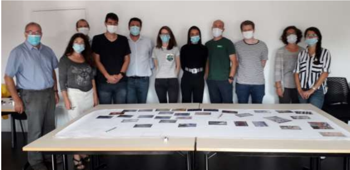
Programme Clim'impact -Atelier chez Optic Performance – Vannes -2020