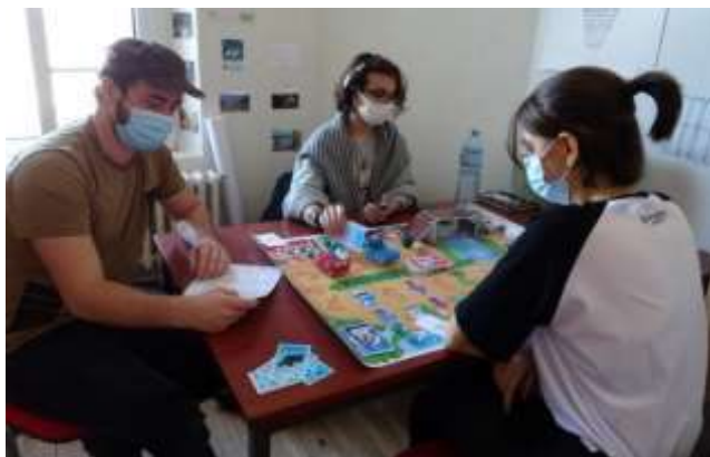
La fabrique du climat

Ces ateliers sont animés par des adhérents de Clim'actions qui ont le savoir-être et le savoir-faire pour partager leurs connaissances. Ces adhérents-formateurs s'engagent à respecter les statuts et la charte de Clim'actions Bretagne Sud.