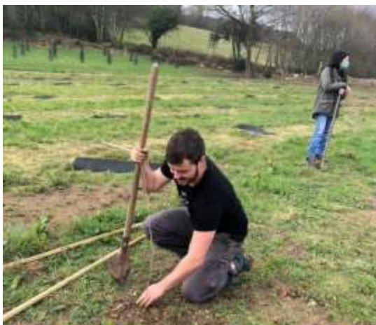
Plantation – Sulniac - 2019

Afin de préparer le territoire au changement climatique, Clim'actions Bretagne Sud anime le programme Forêt et Climat . Les plantations d'arbres permettent d'augmenter le stockage de carbone, favoriser la biodiversité et améliorer la qualité de l'air et paysagère.