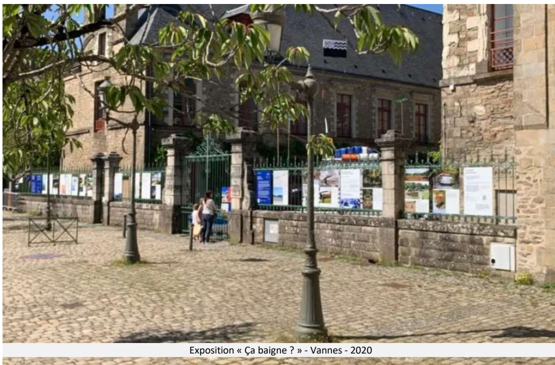
Exposition « Ça baigne ? » - Vannes - 2020

Le Golfe du Morbihan a été choisi comme l'un des territoires de l'étude. Co-Cli-Serv vise à tester les possibilités d'améliorer la prise de conscience par l'ensemble des acteurs d'un territoire face aux conséquences du changement climatique en construisant collectivement un "récit" du futur à la fois réalisable et mobilisateur. Le rôle spécifique de Clim'actions Bretagne sud, appuyé par l'équipe du PNR Golfe du Morbihan, était de réaliser un projet artistique permettant d'illustrer le récit et de faciliter son appropriation par les habitants de notre territoire, sous une forme encore à définir (exposition, recueil imprimé...).