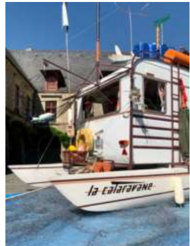
Exposition « ça baigne ? » - Vannes - 2020