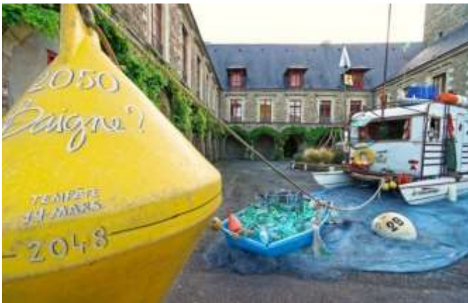
Exposition « ça baigne ? » - Vannes - 2020