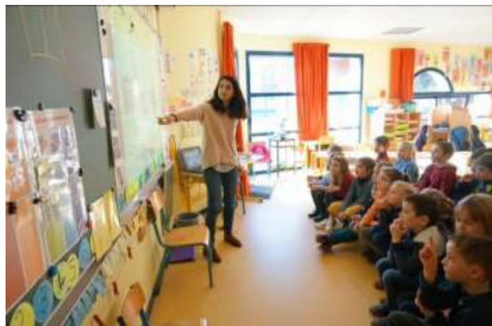
Programme Watty - 2020

Pour comprendre les économies d'énergie et d'eau dès la maternelle Clim'actions Bretagne Sud anime le programme Watty à l'école dans 90 classes du Morbihan et 6 à Lannion. Ce programme vise à sensibiliser les élèves aux économies d'énergie et d'eau en les rendant acteurs des consommations d'énergie et d'eau dans leur établissement et à leur domicile.